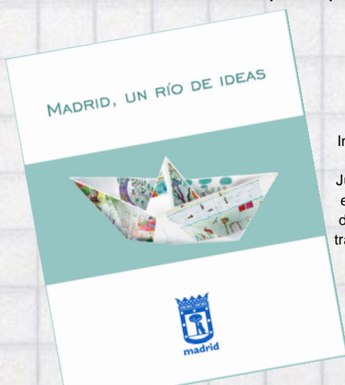
Imagen de los ganadores y finalistas del Concurso de Ideas Infantil y Juvenil Madrid Río , organizado por el Ayuntamiento en 2005, y portada del libro en el que se recogieron sus trabajos, algunos de cuyos dibujos se utilizan en estas páginas como ilustraciones.

Para continuar impulsando la participación de los niños y jóvenes en el diseño final del Proyecto Madrid Río , el Ayuntamiento de Madrid ha remitido ahora a los colegios de Madrid 30.000 ejemplares de un folleto informativo sobre el Plan Especial, en el que se detallan las vías de participación existentes, que permanecerán abiertas hasta el 21 de abril.