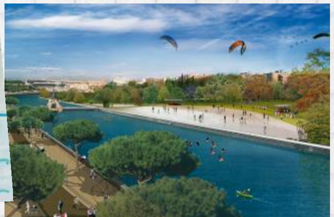
Propuesta de los participantes en el Concurso de Ideas Infantil y Juvenil Madrid Río para que se creara una playa, y recreación virtual de la playa urbana contemplada en el proyecto.